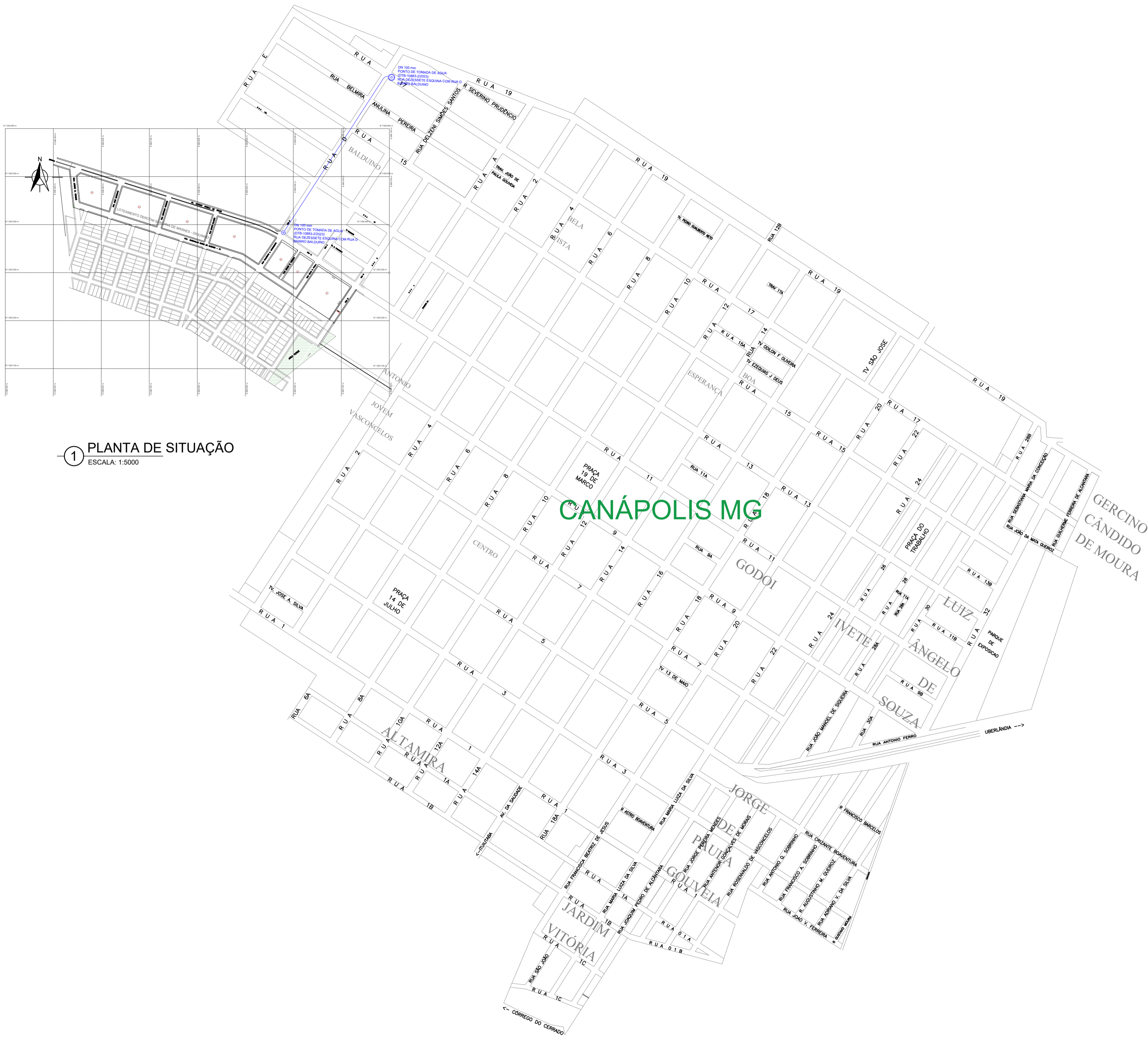
1 PLANTA DE SITUAÇÃO ESCALA: 1:5000