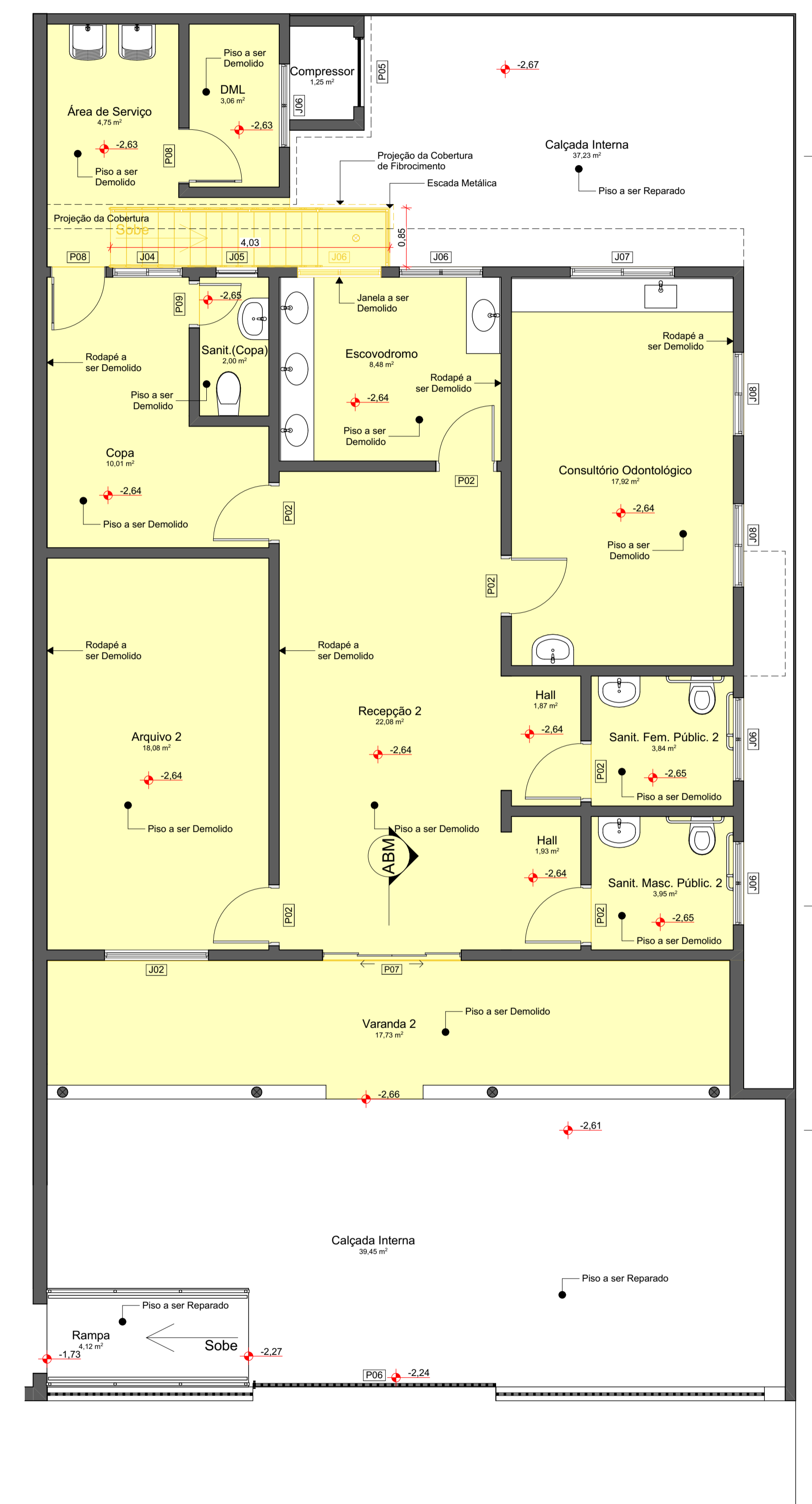
PLANTA - SUBSOLO (DEMOLIÇÃO) Escala: 1:50